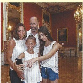
Schloss Ludwigsburg mit Blühendem Barock und Märchengarten

Herausgegeben vom Ministerium für Soziales, Gesundheit und Integration Else-Josefstr. 6 70173 Stuttgart www.sozialministerium-bw.de